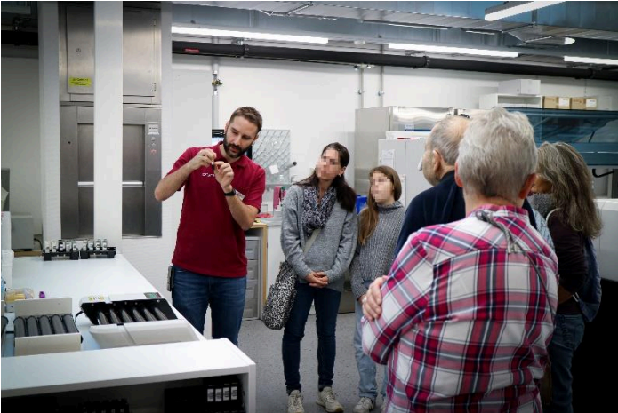
Bild 1: Führung durchs Labor, 4. November 2023

Verlässliche Laborergebnisse sind die Grundlage vieler medizinischer Entscheidungen in Diagnose, Verlauf und Therapie. Die Kosten dieser qualitativ hochwertigen Laboranalytik betragen nur 2 % der Gesundheitskosten in der Schweiz! Deren Ergebnisse jedoch beeinflussen 70 Prozent der medizinischen Entscheidungen. Zusätzlich verhindert sinnvoll indizierte Laboranalytik unnötige Kosten weiterer Abklärungen.