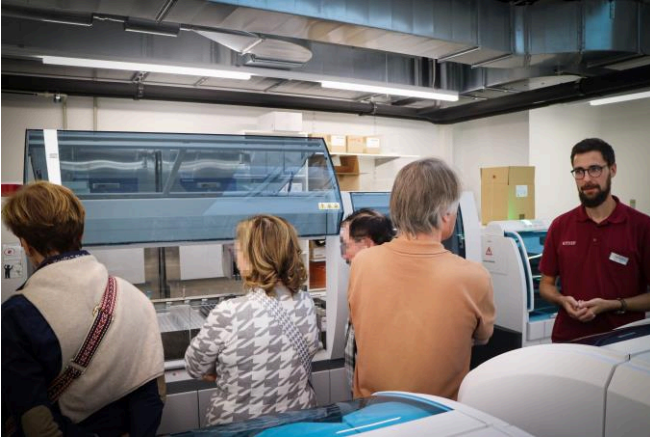
Bild 3: Labortechnik für interessierte Zuschauer

Das Labor Rothen bietet mit ca. 70 Mitarbeitenden Analysen und labormedizinische Dienstleistungen im Auftrag von Aerzten und Spitälern an. Das Analysenspektrum umfasst die klinische Chemie, Immunologie, Hämatologie und Mikrobiologie.